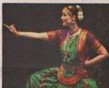
„Im Zeichen des Orients“ kommt wieder in die Flottmann-Hallen.

Mit den drei Bühnenshows von rund 200 Tänzerinnen und Tänzern, einem glitzernden Basar mit Rahmenprogramm im Foyer und sechs spannenden Tanzworkshops für Anfänger und Fortgeschrittene gibt es für die Festivalbesucher Eindrücke für alle Sinne. Sie erleben laut Ankündigung ein farbenfrohes Tanzspektakel: „Träume aus Stoff werden in die Luft gewebt, flammendes spanisches Feuer trifft auf betörenden exotischen indischen Tanz, dynamische Trommelsoli vereinen sich mit frechen urbanen Tanzstilen und erotischem Burlesque sowie Hula Dance, und liebliche persische Hof tänze, leidenschaftliche Stammes tänze sowie orientalischer Tango sind ergänzend zu den klassischen